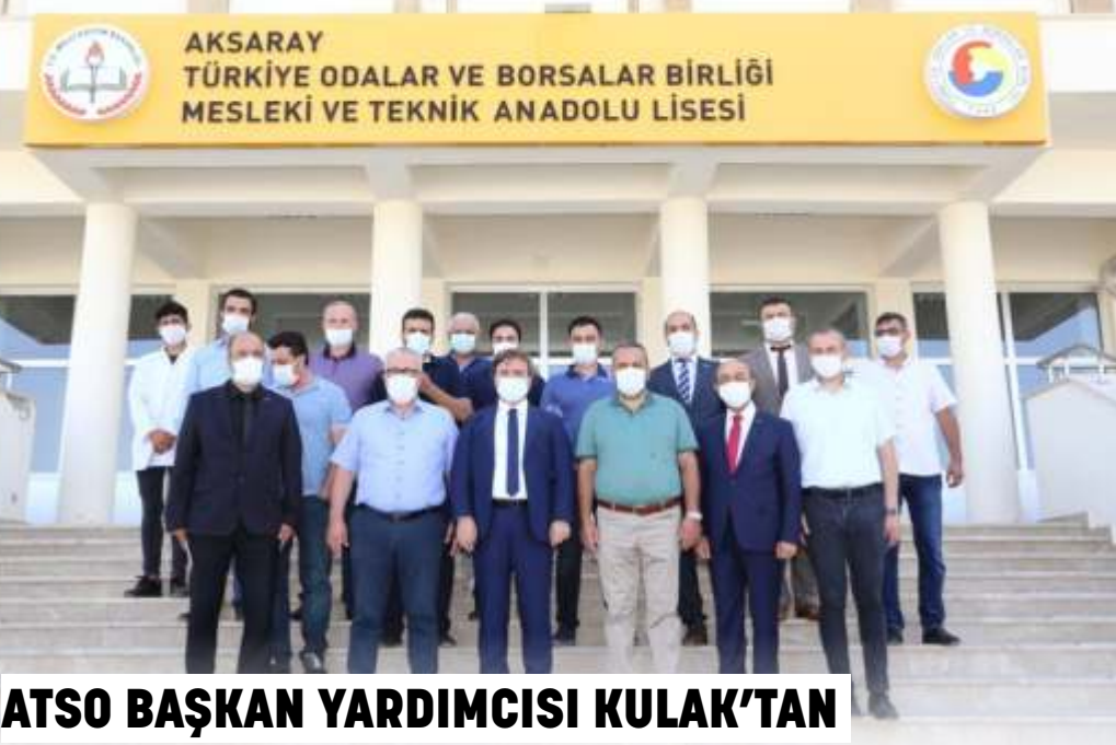
ATSO BAŞKAN YARDIMCISI KULAK'TAN