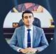
Yasın ARDIÇ Aksaray Vali Yardımcısı (Açılış Konuşması)