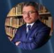
Av. Ali ÇAVUŞOĞLU Türkiye Patent Hareketi Derneği Başkanı